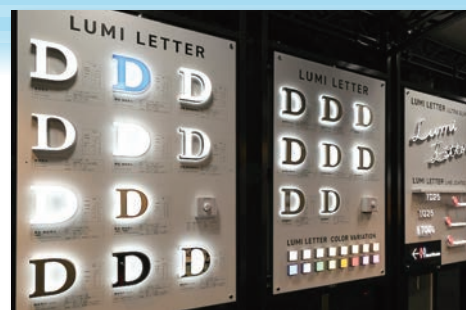
（株）ダイカンの製品

日 時：令和6年10月17日（木） 午後1時～午後3時30分 見学場所：株式会社ダイカン 大阪オフィス（ショールーム）・本社工場 見学参加者：ドラム缶7社 11名