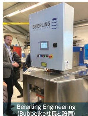
Beierling Engineering (Bubbelke社長と設備)

ドラム缶製造設備に特化したBeierling Engineering社は、1972年設立のドイツ企業で、今回の視察がドラム缶工業会として初の訪問となりました。同社はオールサーボ化や非熟練作業でも扱いやすいインターフェイスを採用し、省エネや自動化、省力化に優れた装置の開発を強みとしています。また、顧客のカスタマイズニーズへの柔軟な対応も、同社の強みです。視察した刻印プレスやマルチタイプ天板口金装着機は、従来設備と比べ大幅に進化しており、同社の設備は工業会会員にとって有力な選択肢となり得るものでした。