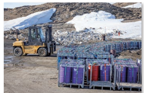
南極で使用されるドラム缶

最後に、南極観測船「しらせ」がラミングと呼ばれる技術を使って定着氷を破碎しながら進む様子の動画や、昭和基地での観測隊員による調査活動や生活の様子が紹介されました。南極での生活の厳しさや隊員の創意工夫と、その中で行われる科学的探求の価値が強調され、参加者の関心を集めました。