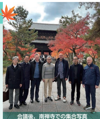
会議後、南禅寺での集合写真