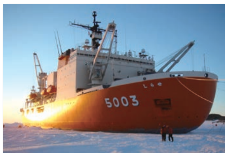
南極観測船「しらせ」